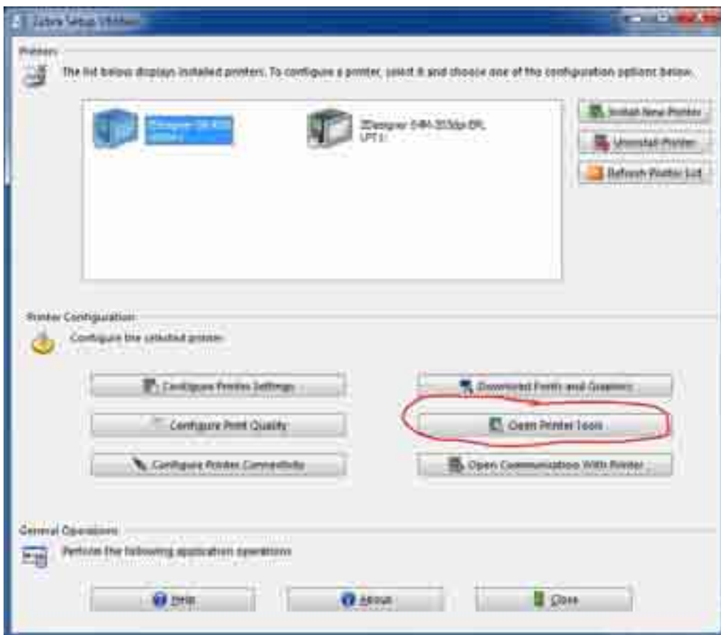
Slika 2: Prozor programa Zebra Setup Utilities.